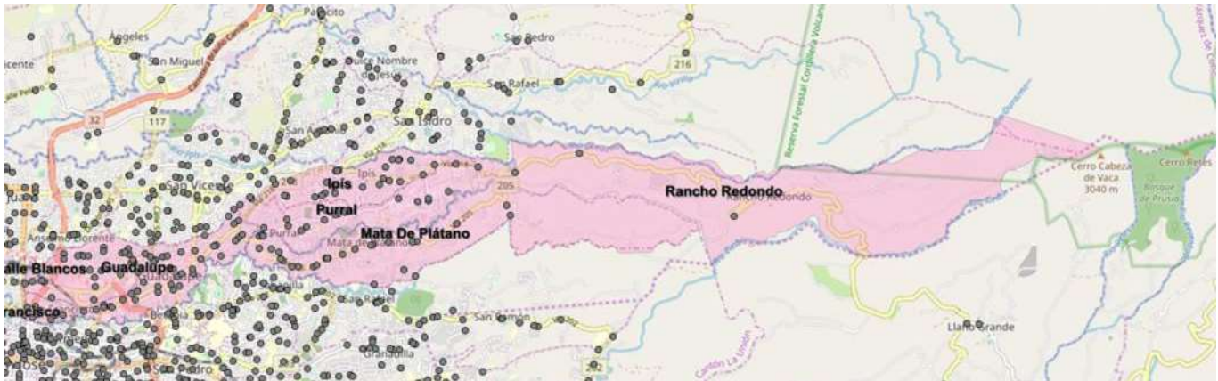
Ilustración 2: Cobertura de los nodos de las empresas de telecomunicaciones. Cantón de Goicochea. Año 2018.

Nota: Las figuras del mapa representan nodos de operadores de telecomunicaciones. Los nodos se presentan todos del mismo color en virtud de que la ubicación de estos es confidencial de conformidad con la resolución RCS-212-2019 de la 18:30 horas 13 de agosto del 2019.