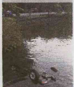
En el vehículo iban tres menores y cuatro adultos. ALFONSO QUESADA

GOLFITO. Una niña de dos años falleció ayer en la clínica de Puerto Jiménez, Golfito, adonde fue trasladada luego de que el vehículo Suzuki Sidekick en que viajaba junto a otras seis personas volcó aparatadamente y cayó al mar. El accidente se registró a las 4:15 p. m. sobre el puente situado en las cercanías del Hotel Agua Luna, en Puerto Jiménez. El vehículo era conducido por un hombre de apellido Rodríguez, quien quedó detenido, según informó la Policía. ALFONSO QUESADA, CORRESPONSAL GN.