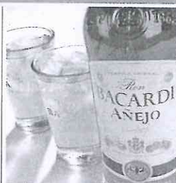
Bacardí recluta empleados para su centro de servicios.

La compañía comenzará a reclutar una cantidad aún no deter-