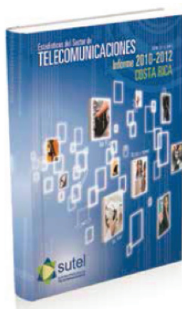
Figura N° 1. Estadísticas del sector telecomunicaciones. Informe 2010-2012.