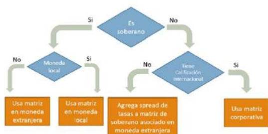
Figura 1. Probabilidad base.

Para el cálculo de la probabilidad de impago se usa una descomposición en probabilidad base y una dependencia en variables macro. La probabilidad base emplea estimados de Standard and Poor's con base en la calificación. La dependencia en variables macro se usa para proyectar la probabilidad a futuro con base en escenarios determinados por el Banco de Costa Rica. Para la pérdida dado impago se usan estimaciones de Moody's. El procedimiento de cada una se ilustra en las figuras 1 y 2, que se muestran a continuación: