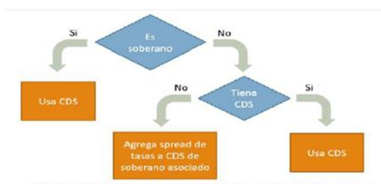
Figura 2. Proxy para dependencia en variables macro.

Emisores corporativos con CDS: se usa un análisis similar al de los Emisores soberanos, pero utilizando las matrices de estudio corporativo de Standard and Poor's. Se presume que todo emisor con CDS tiene calificación internacional.