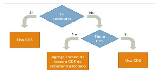
Figura 2. Proxy para dependencia en variables macro.

De acuerdo con NIIF 9, el cargo por deterioro se calcula a doce meses plazo a menos que se determine que se dio un deterioro significativo en la calidad crediticia desde el momento de la compra. Si hay deterioro se usa un cálculo al tiempo de vida del instrumento. Este incremento en el plazo puede generar un aumento significativo en la estimación. Los criterios para determinar si hubo un deterioro significativo en la calidad crediticia son: