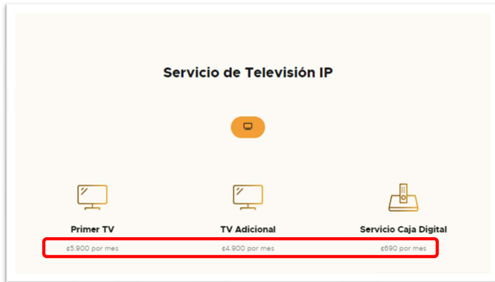
Imagen 1. Planes GAM. Consulta realizada del sitio WEB https://fibraencasa.cr/planes-gam/ el 28 de agosto de 2024.

Pese a ello, en el servicio de IPTV no se aprecia el impuesto del IVA ni las tasas de ley, según se observa a continuación: