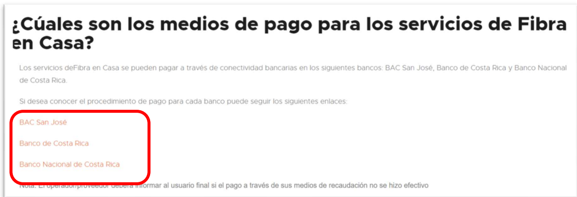
Imagen 3. Medios de pago.

De esta manera, se reitera a Fibra en Casa que debe atender la corrección de los siguientes aspectos; lo anterior, por cuanto, muchas de las observaciones ya fueron previamente realizadas por esta Dirección mediante oficio número 07655-SUTEL-DGC-2024 del 29 de agosto de 2024, según se detalla a continuación.