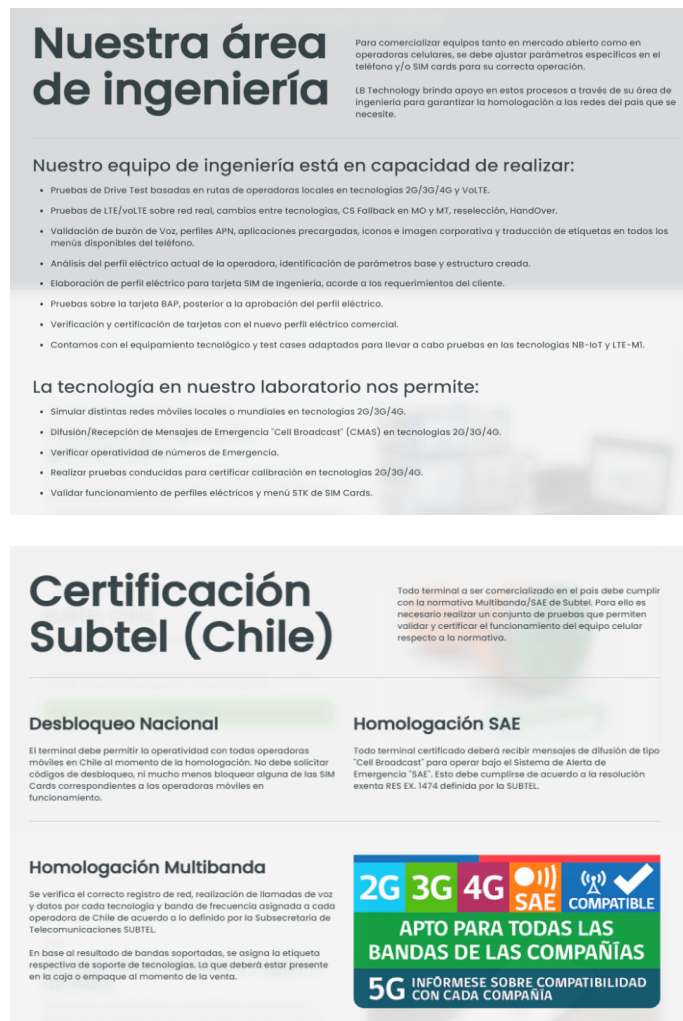
Imagen 1.

Para acreditar lo anterior, LB remitió una lista de clientes, con especificación de las pruebas efectuadas para cada uno. De igual forma, remitió al sitio WEB, donde se visualizan los servicios que esta empresa ofrece, según se observa de seguido: