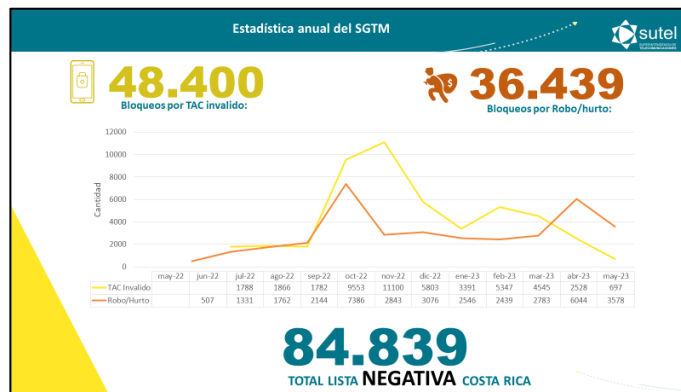
Imagen 2: Dispositivos bloqueados