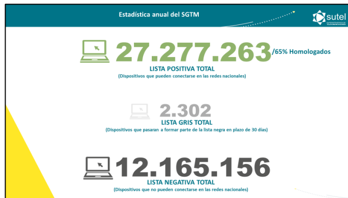
Imagen 3: Resultados generales