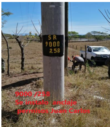
Imagen 5: Correo de Jonathan Leiva (CABLETICA) a Ronald Palma (CABLETICA), aportada como prueba de CABLETICA