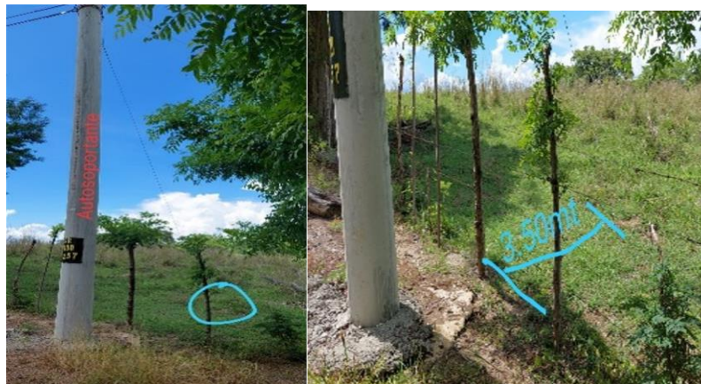
Imagen 3 y 4: Tomadas de Prueba documental aportada por CABLETICA en la solicitud de intervención