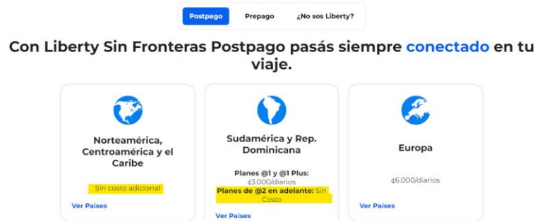
Imagen 4: Planes de Roaming Internacional de datos de Liberty . (Consulta realizada el 13 de setiembre de 2023 7 ).

Al viajar, podés navegar con los datos de tu plan postpago o con tus packs de internet prepago.