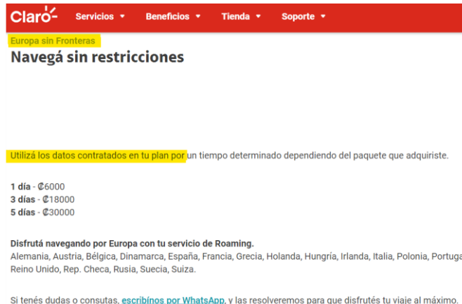
Imagen 3: Planes de Roaming Internacional de datos de Claro . (Consulta realizada el 13 de setiembre de 2023 6 ).