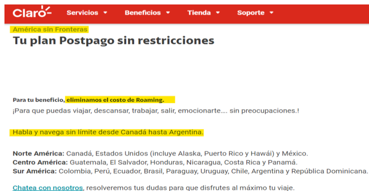
Imagen 2: Planes de Roaming Internacional de datos de Claro. (Consulta realizada el 13 de setiembre de 2023 5 ).